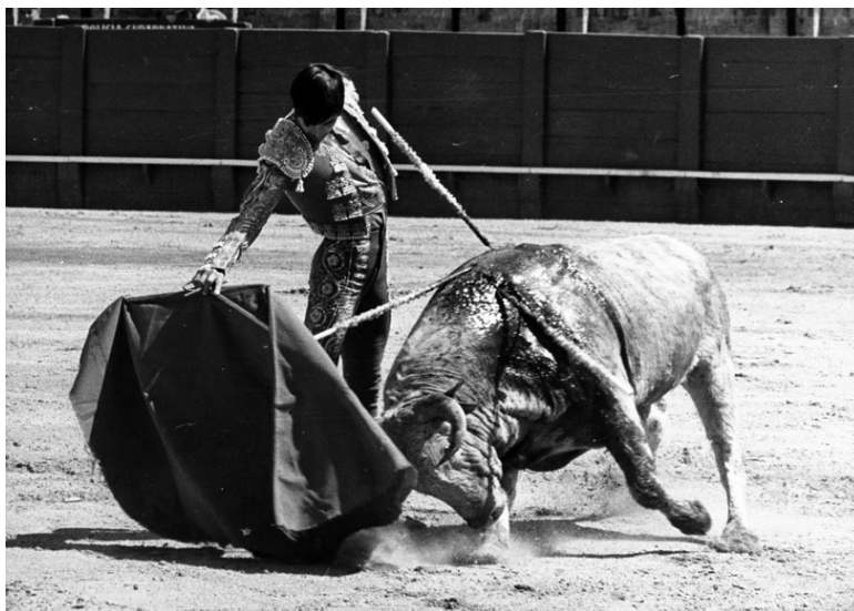
Fonds Isabelle Montcouquiol