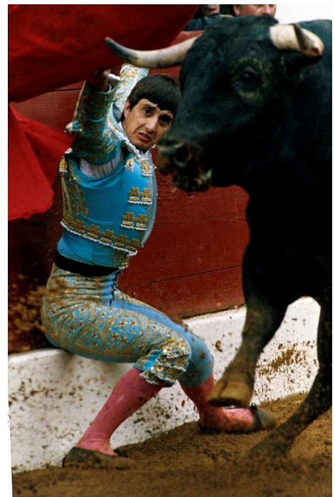
Fonds Isabelle Montcouquiol

Dans cette salle, des écouteurs seront mis à la disposition des visiteurs pour entendre une interview que Nimeño II avait donnée à propos de l'anniversaire de ses dix ans d'alternative pour l'émission « Contact » de Sud Radio, et diffusée le 29 Mai 1987.